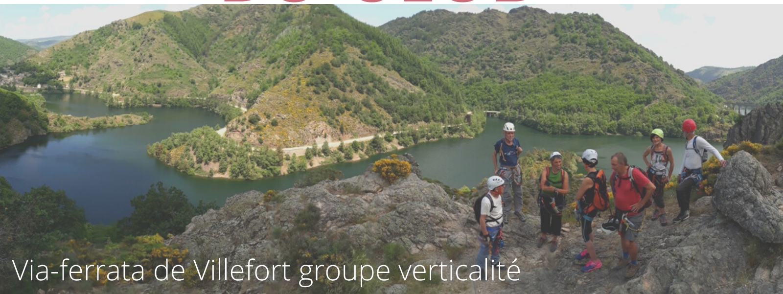
Via-ferrata de Villefort groupe verticalité